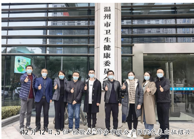
12月12日,5位“检验人”作为市级公立医院代表出征绍兴

近日,省内接连出现新冠肺炎确诊病例,我市面临的疫情防控形势相当严峻,为高质量落实好市委、市政府及市卫健委对新冠肺炎疫情防控各项决策部署,医院全体职工“紧起来、动起来、严起来”,从“平时”模式转入“战时”机制,众志成城打好“外防输入”阻击战。